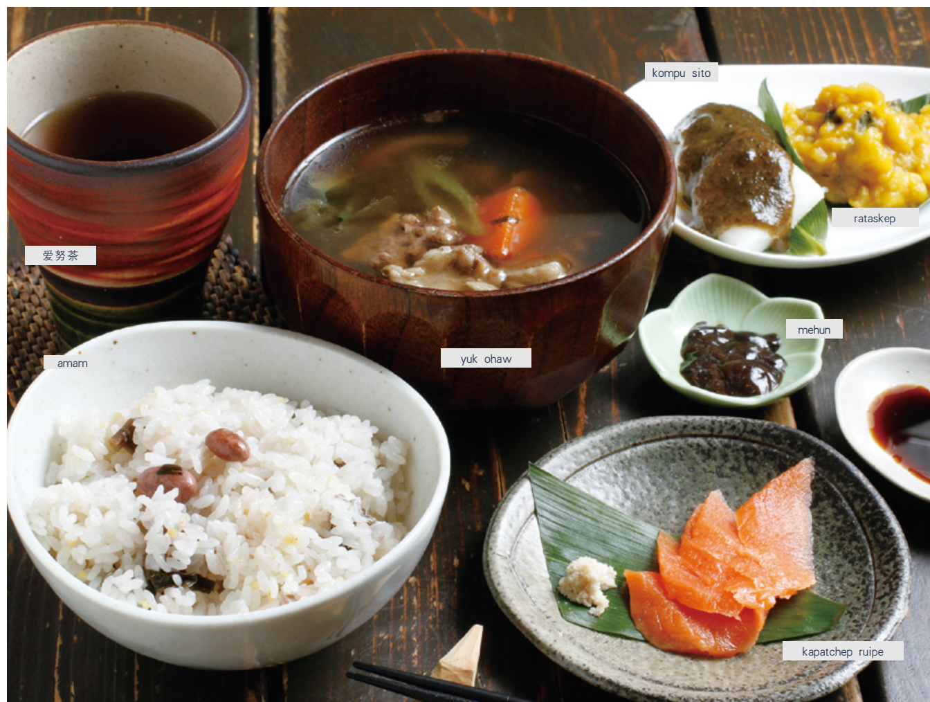
※根据季节的不同提供的饮食会有变化。